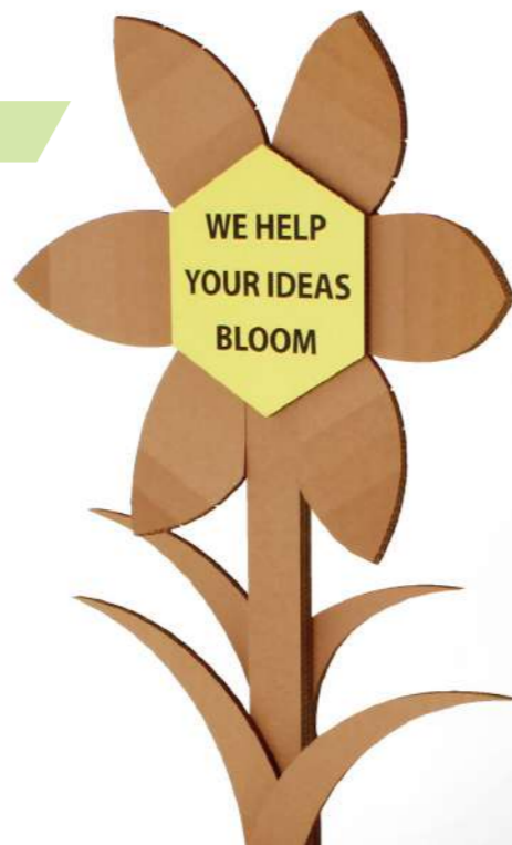
Gadget personalizzati Customized gadget

La vetrina è il vostro biglietto da visita, uno spazio che deve sorprendere ed affascinare il cliente. Il design originale ed accattivante delle soluzioni in cartone trasformerà la vostra vetrina in uno spazio di forte impatto visivo e comunicativo.