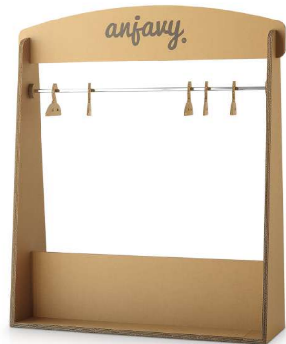
Appendiabiti su misura Custom-made dress hanger

THE RIGHT DISPLAY TO SHOWCASE YOUR PRODUCT