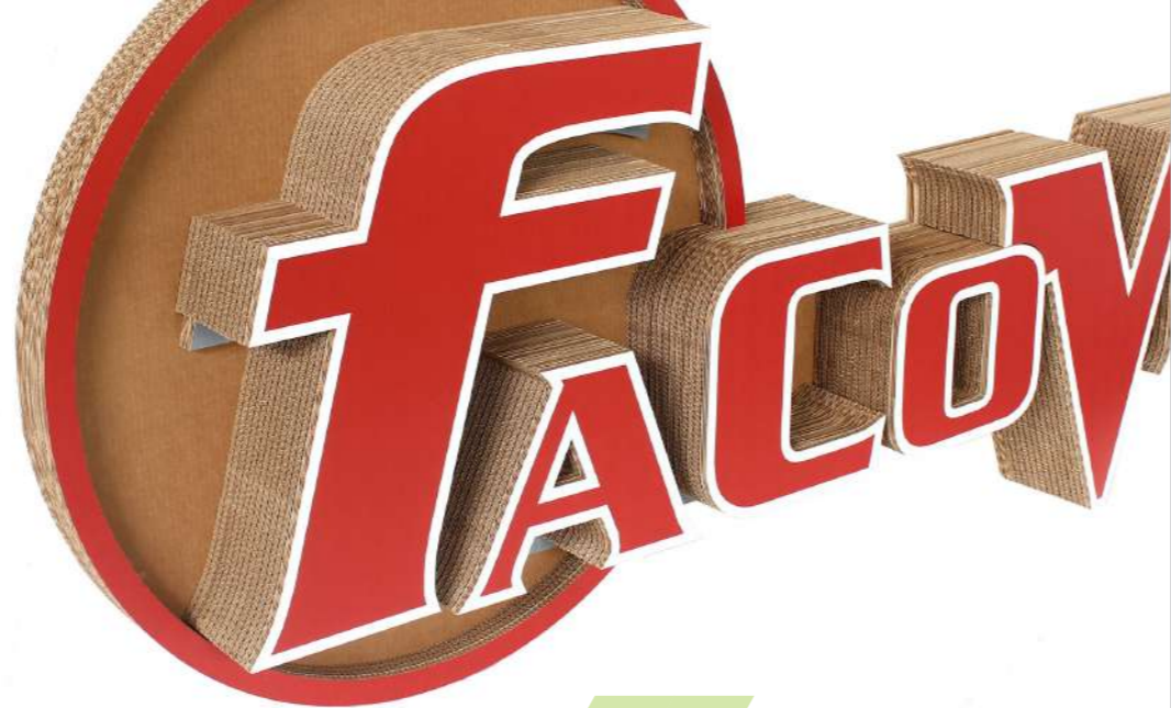
Logo tridimensionale personalizzato Customized three-dimensional logo