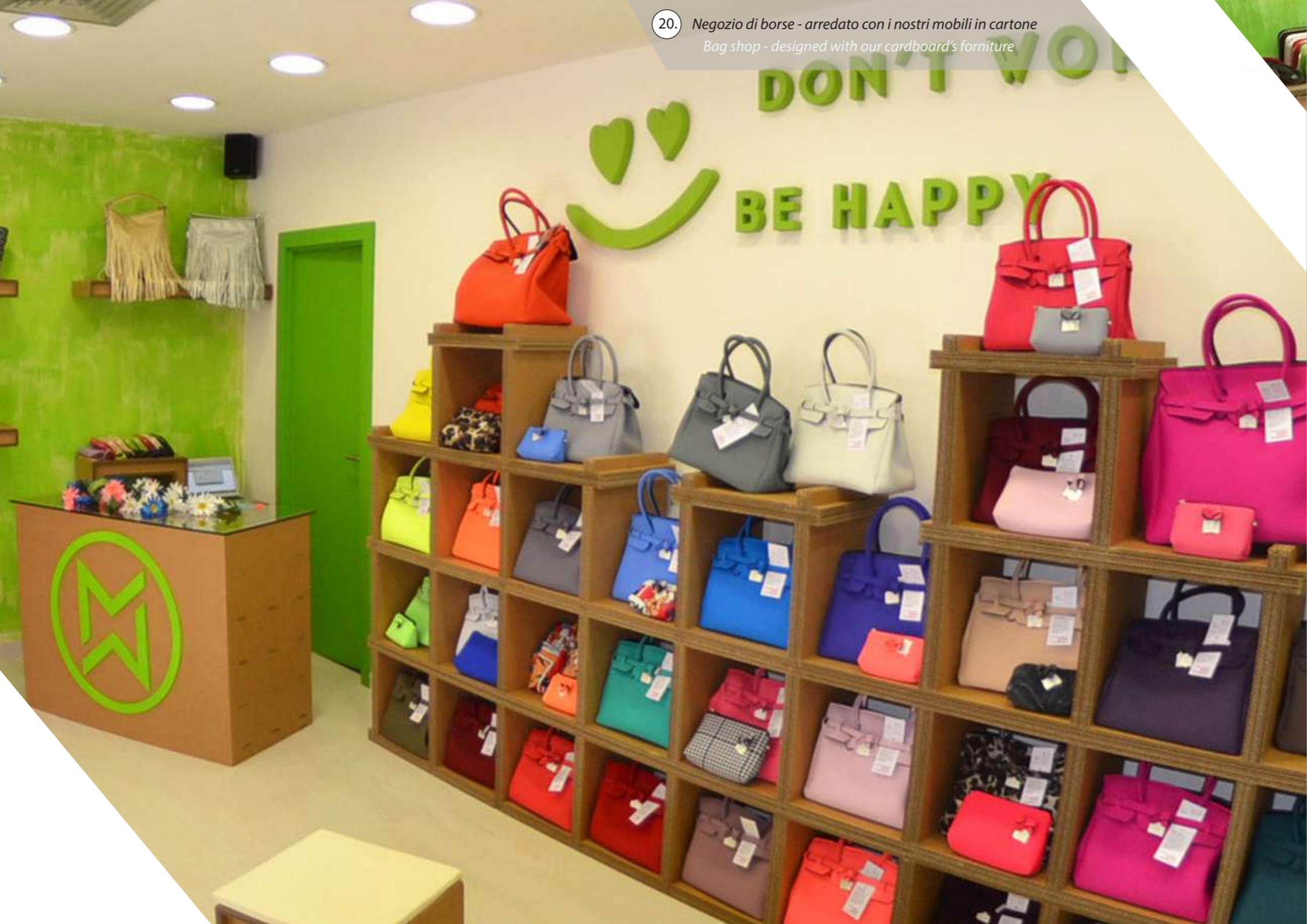
20. Negozi di borse - arredato con i nostri mobili in cartone Bag shop - designed with our cardboard's furniture