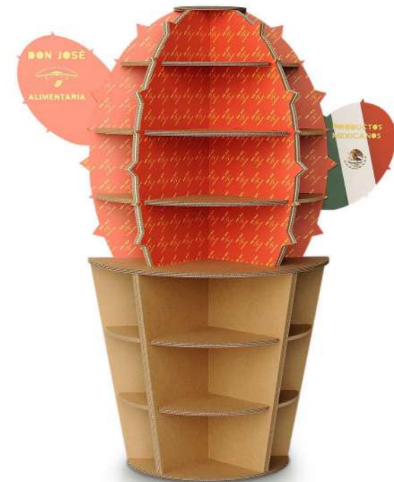
Espositore su misura Custom-made display