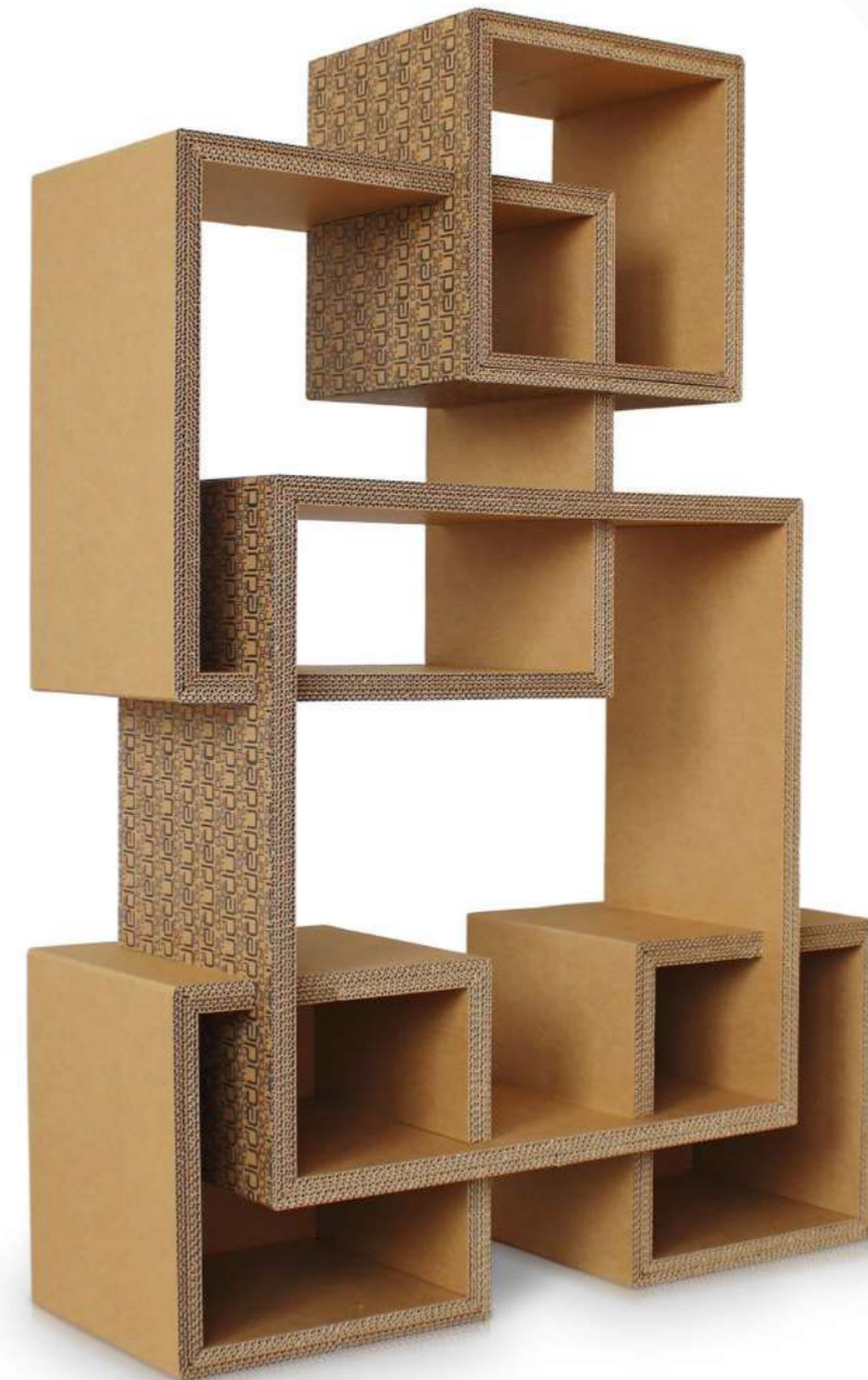
24. Espositore dalla forma accattivante per ogni esigenza

We are here for you to design and create unique elements for every window shop, everything tailor-made for you.