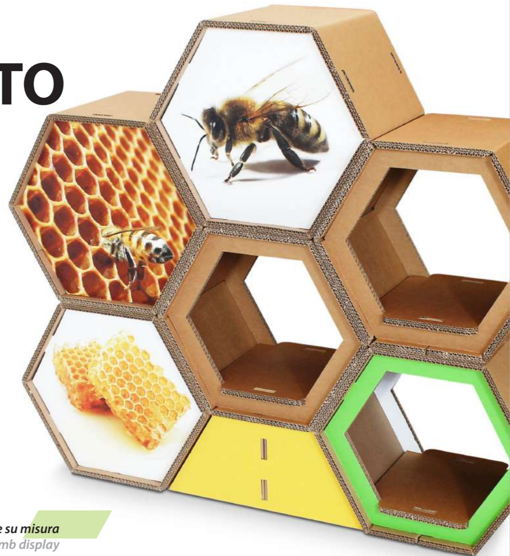
Espositore alveolare su misura Custom-made honeycomb display

Oltre ad una vasta gamma di espositori a catalogo, la nostra azienda realizza espositori completamente su misura, pensati per esaltare al meglio i vostri prodotti. Forme, dimensioni, colori e stampe sono quindi degli alleati, per realizzare soluzioni espositive uniche, a basso impatto ambientale.